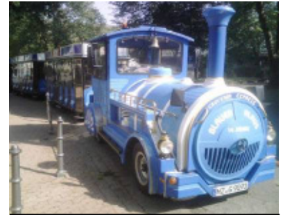
Der „Blauer Klaus“

Ein herzlicher Dank gilt den vielen Helferinnen und Helfern für ihr ehrenamtliches