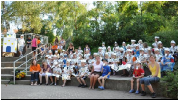
Die Ferienspielekinder als Astronautinnen und Astronauten