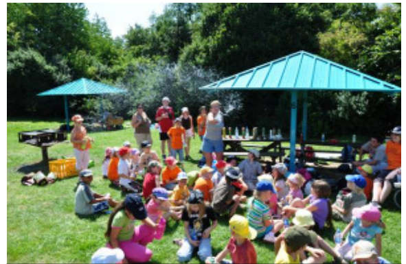
Kalte Dusche auf dem Kuhberg in Bad Kreuznach